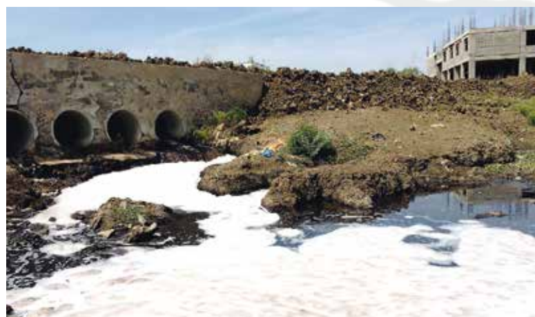
Durch die Chromgerbung verschmutztes Wasser