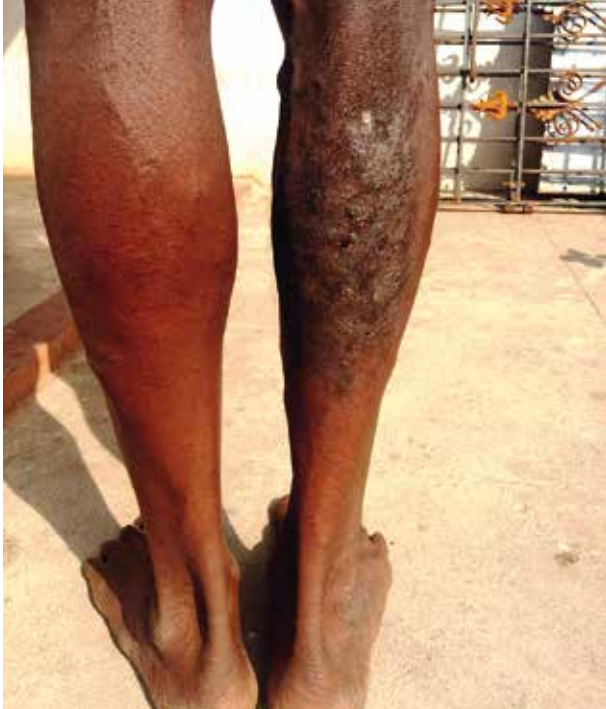
Ein Gerbereiarbeiter leidet unter einer Hauterkrankung

Sozialversichertenkarte und Arbeitsverträge ausstellt, besaß niemand der Befragten einen solchen Beschäftigungsnachweis. Außerdem hatte niemand der Befragten ein Anrecht auf bezahlten Urlaub.