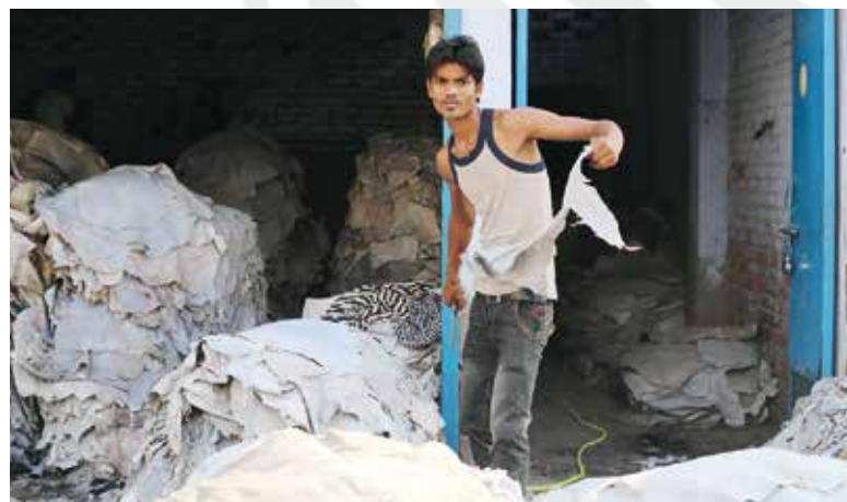
Gerbereiarbeiter in Uttar Pradesh

Die von uns durchgeführten Interviews mit GerbereiarbeiterInnen in Nord- und Südindien zeigen, dass größtenteils männliche Lohnarbeiter im Ledersektor unter meist prekären Umständen arbeiten. Niedrige Monatslöhne von etwa 100 EUR, unregelmäßige Arbeitsverhältnisse, keine Absicherung durch die staatliche Angestelltenversicherung (ESI) und die Mitarbeitervorsorgekasse (EPF) sowie lange Arbeitszeiten sind die Hauptprobleme, mit denen die ArbeiterInnen konfrontiert sind. Die meisten Personen arbeiten nur zeitweise bzw. befristet, ohne vertragliche Grundlage und ohne Aussichten auf eine Festanstellung. Obwohl das indische Arbeitsvertragsgesetz vorsieht, dass der Arbeitgeber seinen ArbeiterInnen Kranken- und