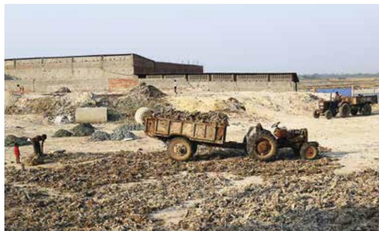
Entsorgung von Feststoffabfällen am Flusssufer